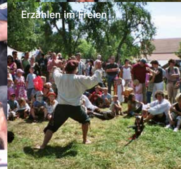
Erzählen im Freien