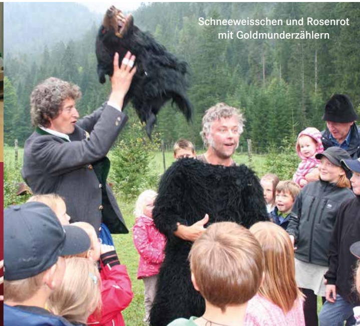
Schneeweißchen und Rosenrot mit Goldmunderzählern